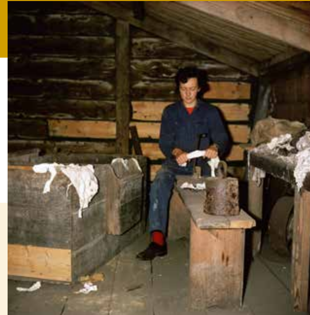
1972 en 2020 Het scheuren van de vodden die een belangrijke grondstof zijn voor het maken van papier. In het scheurhok worden de vodden eerst op kleur en materiaal gesorteerd, ontdaan van knopen en daarna in kleine stukjes gescheurd. Op deze foto's is de scheurbank goed te zien, met het mes om een inkeping in de vodden te maken als beginnetje van het scheuren.