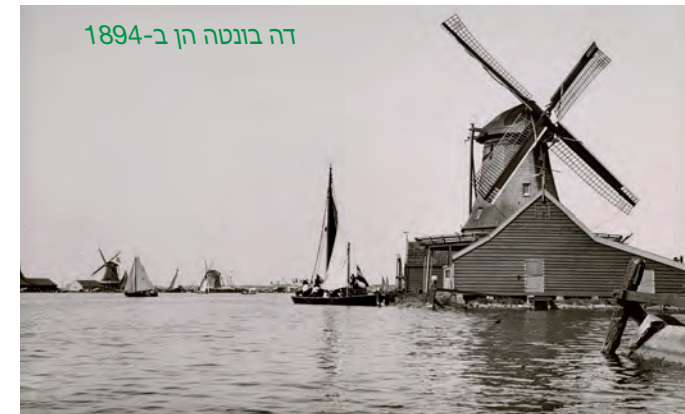
דה בונטה הן ב-1894

הזרעים נטחנו לאבקה ועברו תהליך כבישה להפקת שמן.