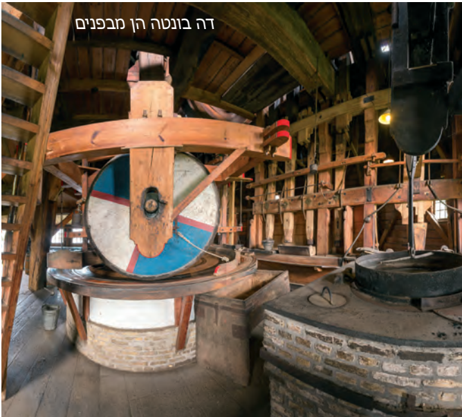
דה בונטה הן מבפנים