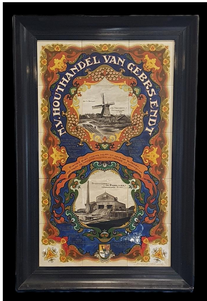
Tegeltableau houthandel Endt 1

Boven genoemde schenkingen zijn slechts een selectie van alles wat wij mochten ontvangen.