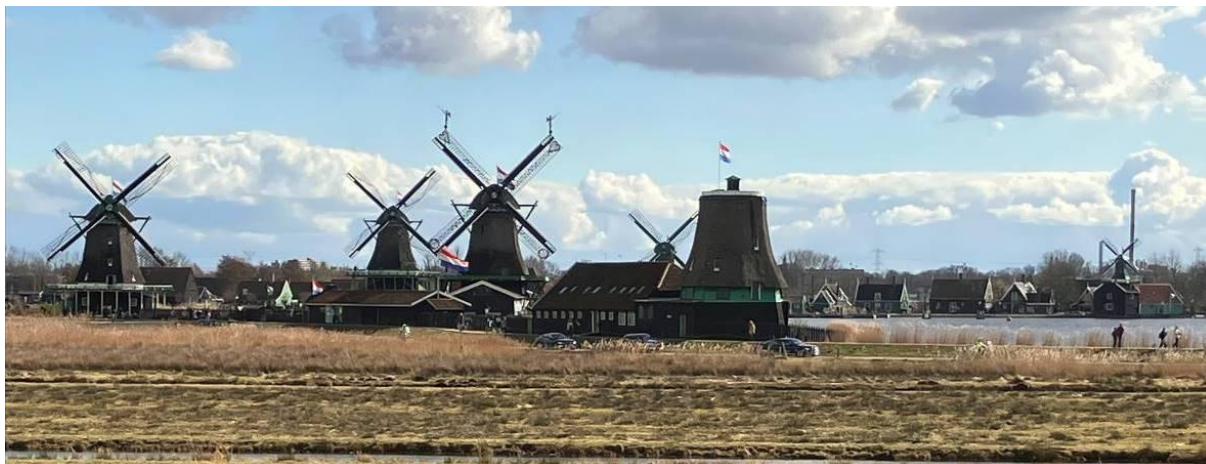
Molens in vreugdestand gericht op het Molenmuseum, terwijl de koninklijke stoet juist De Os passeert

In het kader van het jubileum bezocht op 14 maart prinses Beatrix het Molenmuseum. In tegenstelling tot andere bezoeken van de beschermvrouwe van De Hollandsche Molen, stonden de molens in de Zaanstreek die dag niet vrolijk te draaien. Geheel in lijn met de traditie stonden alle molens in vreugdestand met het wienkruis gericht op het Molenmuseum, de zeilen om het hekwerk geslagen. Keurig in gelid. Net als bij eerdere koninklijke bezoeken, waarvan op de beeldbank foto's te vinden zijn, werden enkele molens eenvoudig mooigezet. Als voorbeeld diende een foto uit 1899 van De Koperslager (toen koningin Wilhelmina en koningin-moeder Emma de molen passeerde) en een kiek van Het Jonge Schaap uit 1908 tijdens een bezoek van koningin Wilhelmina en prins Hendrik. Nu werden De Bonte Hen en Het Jonge Schaap op deze wijze mooi gezet. Gecombineerd met de andere molens in vreugdestand en het gebruik van de driekleur maakte het niet alleen stijlvol maar vooral mooi en traditioneel Zaans.