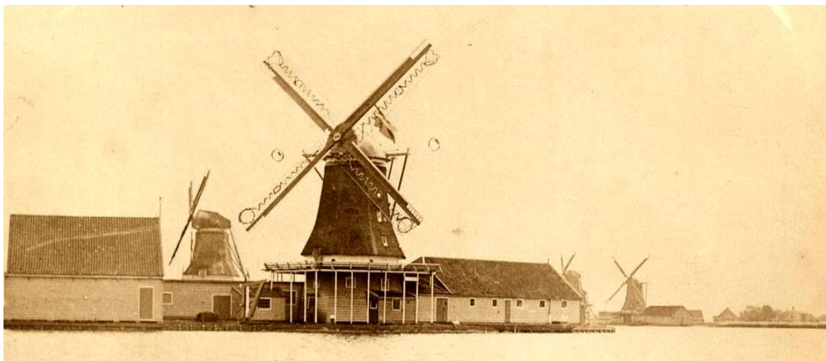
Oliemolen De Wachter in 1887-1889