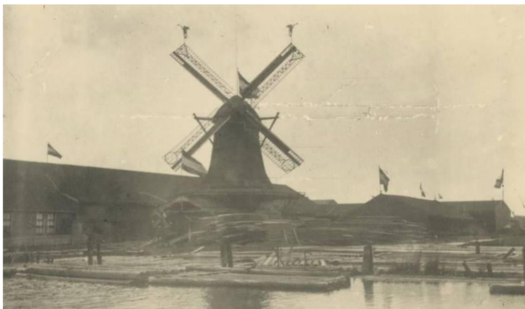
Houtzaagmolen Het Jonge Schaap 28 april 1908

In augustus vonden de activiteiten voor het jubileum plaats. Naast muziek, eten en drinken, werd een programma gedraaid gericht op de jeugd. Kinderen konden zich vermaken met allerlei oud-Hollandse spellen, knutselen en timmeren, zich verkleden als molenaar, een vogelhuisje maken en zelf meel malen. Alles bij elkaar een zeer geslaagd evenement.