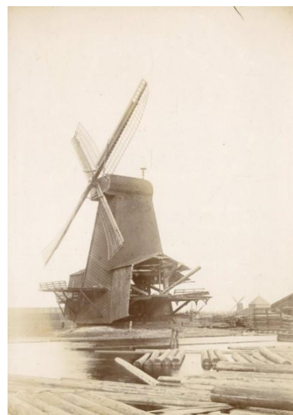
Inv. nr. 0050656, houtzaagmolen de Wilde 1 Inv. nr. 0050656,